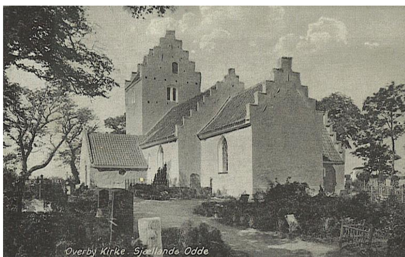
Motiv fra Bay postkort