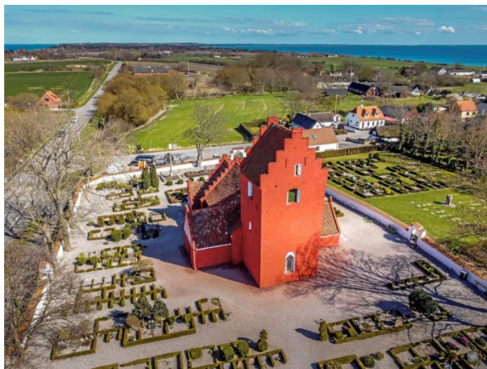
Odden Kirke. Skråfoto af beliggenheden på Odden og Overby