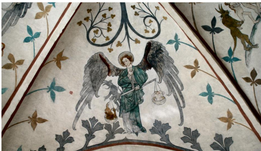
Del af dommedag. Ærkeenglen Mikael vejer en sjæl. Dateret ca. 1200-1410