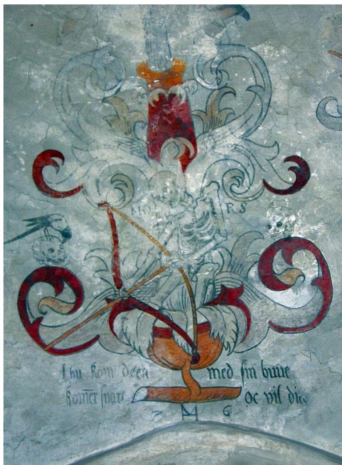
Kalkmaleri, Odden kirke

Odden kirke er ombygget og restaureret. Kalkmalerier er reddet og orglet flyttet og udbygget. Kirken har været lukket i et års tid, - et projekt med et budget på ca. 5 millioner kr. Kirken er genåbnet her i marts. Kalkmalerierne er afrenset og restaureret.