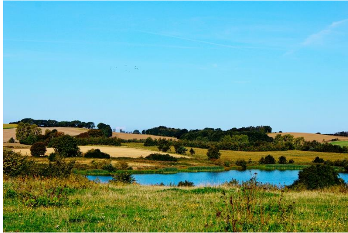
Den genskabte Højby Sø beliggende nord for Hotel Højbysø