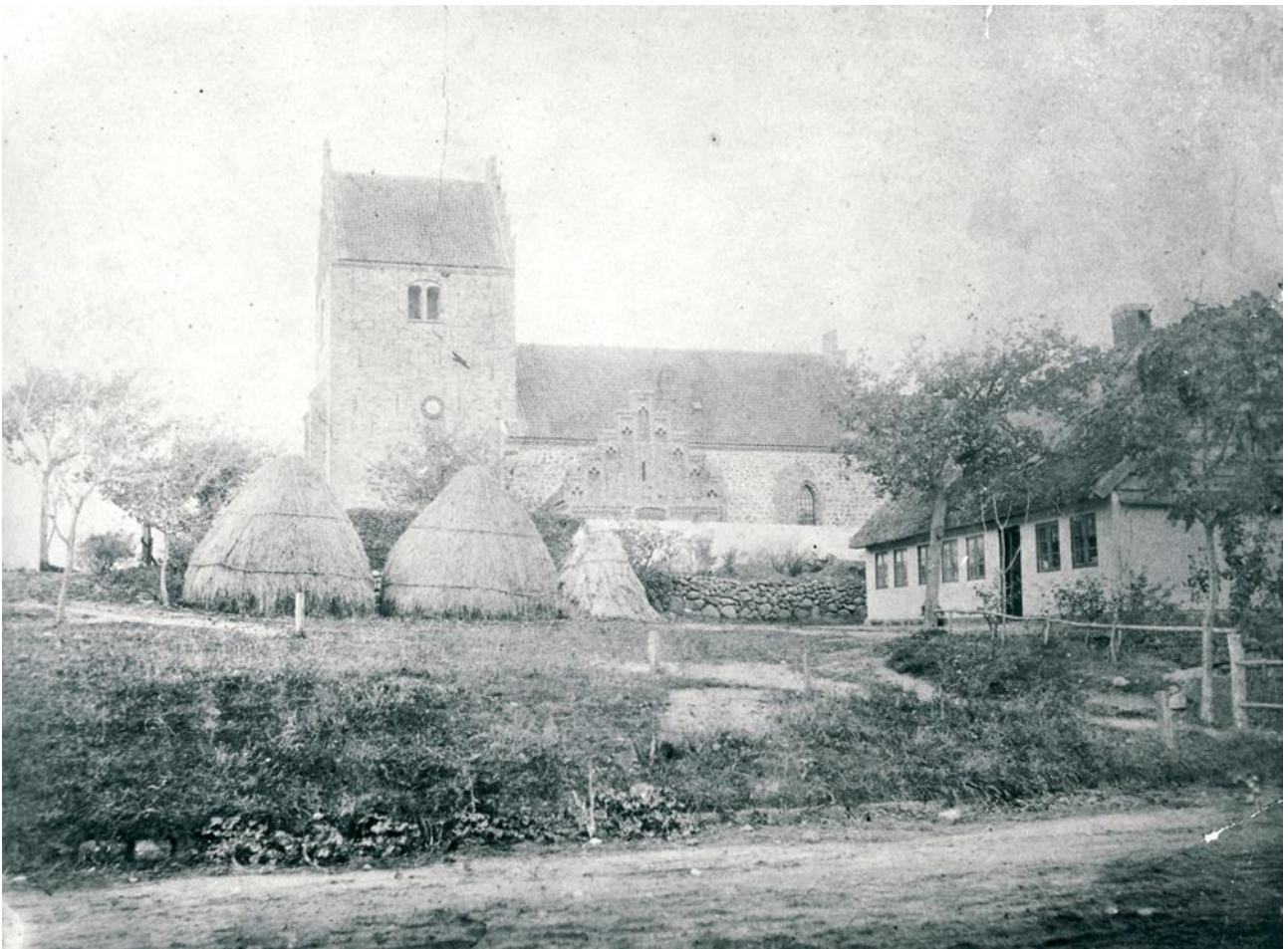
Højby Kirke set fra syd ca. 1910